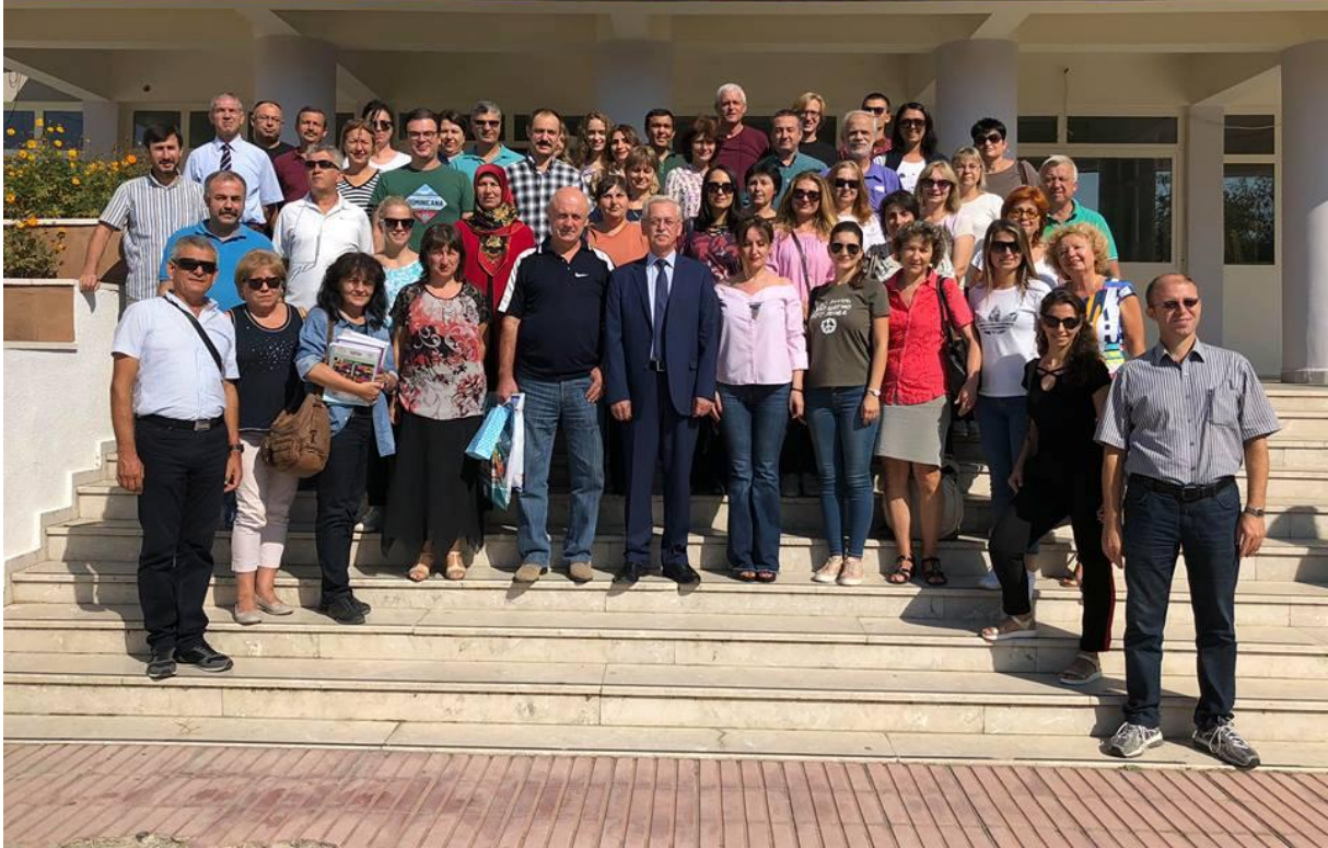
Откриване на новата 2018/2019 учебна година и първа копка на физкултурния салон!!!