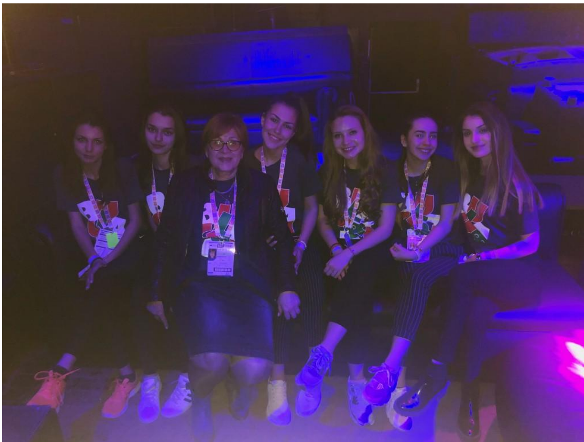
Пресцентър на ПГПЧЕ“Екзарх Йосиф“