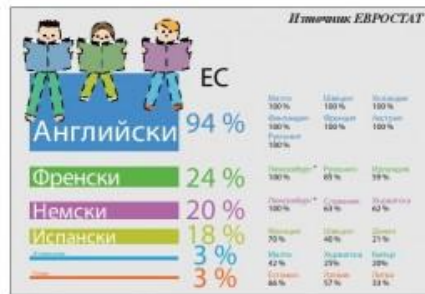
Държави членки на ЕС с най-голям дял на изучаващите чужд език в гимназията като процент от общия брой ученици

Над 97 на сто от децата започват чуждоезиково обучение в начален етап в Кипър, Люксембург, Малта, Австрия, Хърватска, Италия, Испания, Франция и Полша. Задължителен втори чужд език трябва да се учи от децата в Люксембург, което е логично, преди да се представят при официален език. По два езика учат близо 33 на сто от най-малките ученици в Естония и 26 на сто от децата в Гърция. В другия край