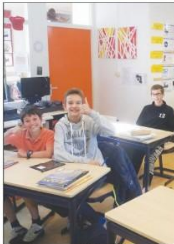
Макар и да се забавляваха, децата от училище „Св. св. Кирил и Методий“ в Лайден показаха добро познаване на българския език

Победителите получиха награди шапки и детски книги. Аз Буки