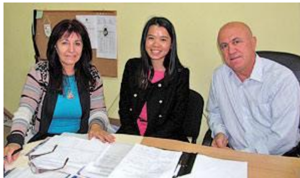
29.09.2015г. - посещение на вицепрезидент Маргарита Попова за откриване на проект "Часове по демокрация"